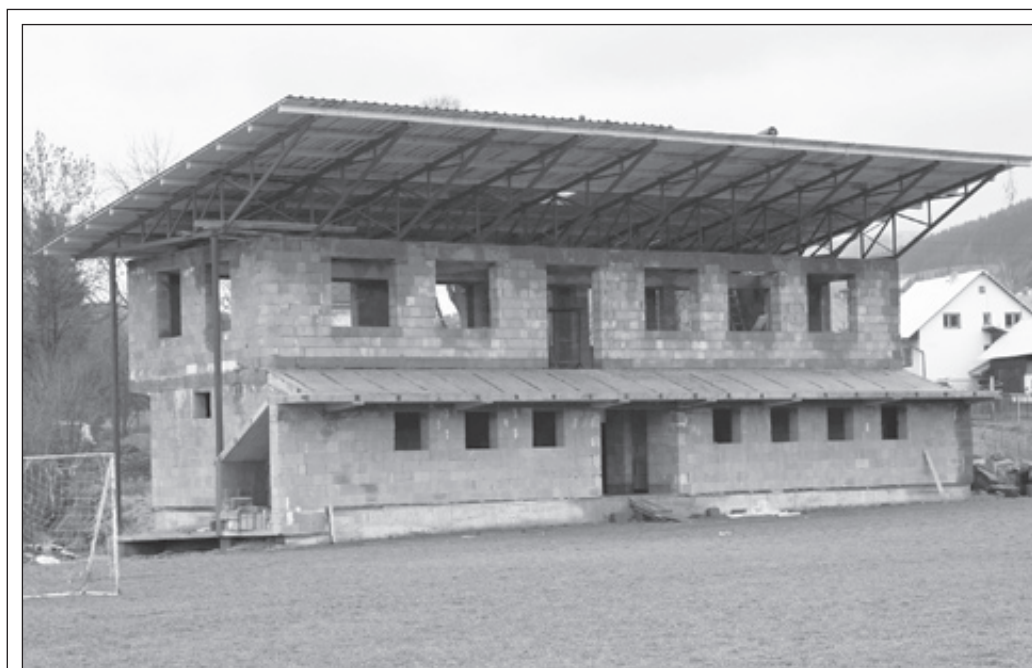
Rozostavaná tribúna na futbalovom ihrisku

Obec ďakuje za doterajšiu pomoc pri výstavbe športovcom, podnikateľom a občanom